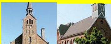
Ev. Kirchengemeinde Beyenburg-Laaken